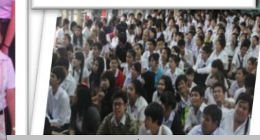
กองเชียร์ต่างลุ่มน้ำใจเพื่อนของทນชนะการแข่งขัน