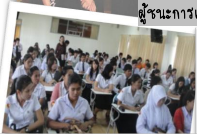
ผู้เข้าร่วมการแข่งขันตอบปัญหาภาษาอังกฤษ