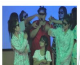
ผู้เข้าร่วมการแข่งขันร้องเพลงภาษาอังกฤษ...