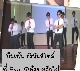
ทีมเต้น กังนัมสโตร์... ที่ Psy ยังต้องหลงใหลใน