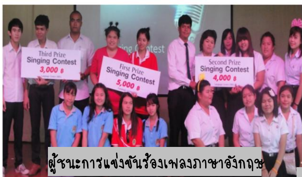
ผู้ชนะการแข่งขันร้องเพลงภาษาอังกฤษ