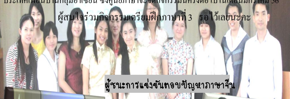
ผู้ชนะการแข่งขันตอบปัญหาภาษาจีน

ศูนย์ภาษา ได้จัดโครงการเผยแพร่ภาษาและวัฒนธรรมนานาชาติ เมื่อวันที่ 12 ก.ย. 55 โดยมีกิจกรรมแข่งขันตอบปัญหาภาษาจีนและภาษาญี่ปุ่น, การแข่งขันร้องเพลงนานาชาติ โดยใช้ภาษาที่ 3, การแข่งขันเต้น Cover และระบำนานาชาติ เพื่อส่งเสริมให้นักศึกษาได้พัฒนาทักษะภาษาที่ 3 และแสดงออกทางวัฒนธรรมนานาชาติ นอกจากนี้ ยังมีมิวมุสาธิต และทดลองแต่งกายชุดนานาชาติ, นิทรรศการอาเซียน และการแข่งขันตอบปัญหาเกี่ยวกับอาเซียน เพื่อให้นักศึกษาตระหนักถึงการเรียนรู้ภาษาและวัฒนธรรมของต่างชาติโดยเฉพาะประเทศเพื่อนบ้านกลุ่มอาเซียน ซึ่งศูนย์ภาษาจะจัดกิจกรรมนี้ครั้งต่อไปในเดือนมกราคม 56 ผู้สนใจร่วมกิจกรรมเตรียมฝึกภาษาที่ 3 รอไว้เลยนะคะ