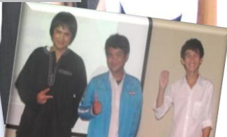
ผู้ชนะการแข่งขันร้องเพลงนานาชาติ... 3 กลุ่ม 3 ชาติ ไม่ซ้ำแนว ...