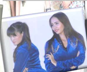
ผู้ชนะการแข่งขันเต้น Cover.