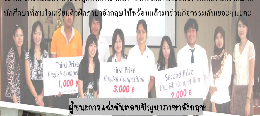
ผู้ชนะการแข่งขันตอบปัญหาภาษาอังกฤษ

ศูนย์ภาษาได้จัดโครงการแข่งขันทักษะภาษาอังกฤษ เมื่อวันที่ 5 กันยายน 55 เพื่อส่งเสริมการเรียนรู้ภาษาอังกฤษแก่นักศึกษาทุกชั้นปี โดยจัดให้มีการแข่งขันตอบปัญหาภาษาอังกฤษในช่วงเช้า ส่วนช่วงบ่ายเป็นการแข่งขันร้องเพลงภาษาอังกฤษ โดยผู้ชนะการแข่งขันทุกประเภทจะได้รับรางวัลเป็นเงินทุนการศึกษา และศูนย์ภาษาจะจัดกิจกรรมนี้เป็นประจำทุกภาคการศึกษา ซึ่งครั้งต่อไปจะจัดขึ้นในเดือนมกราคม 56 นักศึกษาที่สนใจเตรียมตัวฝึกภาษาอังกฤษให้พร้อมแล้วมาร่วมกิจกรรมกันเถอะนะคะ