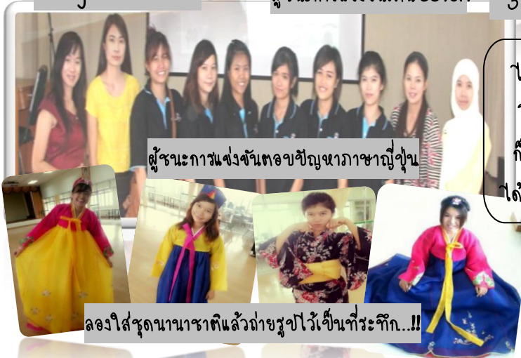
ผู้ชนะการแข่งขันตอบปัญหาภาษาญี่ปุ่น