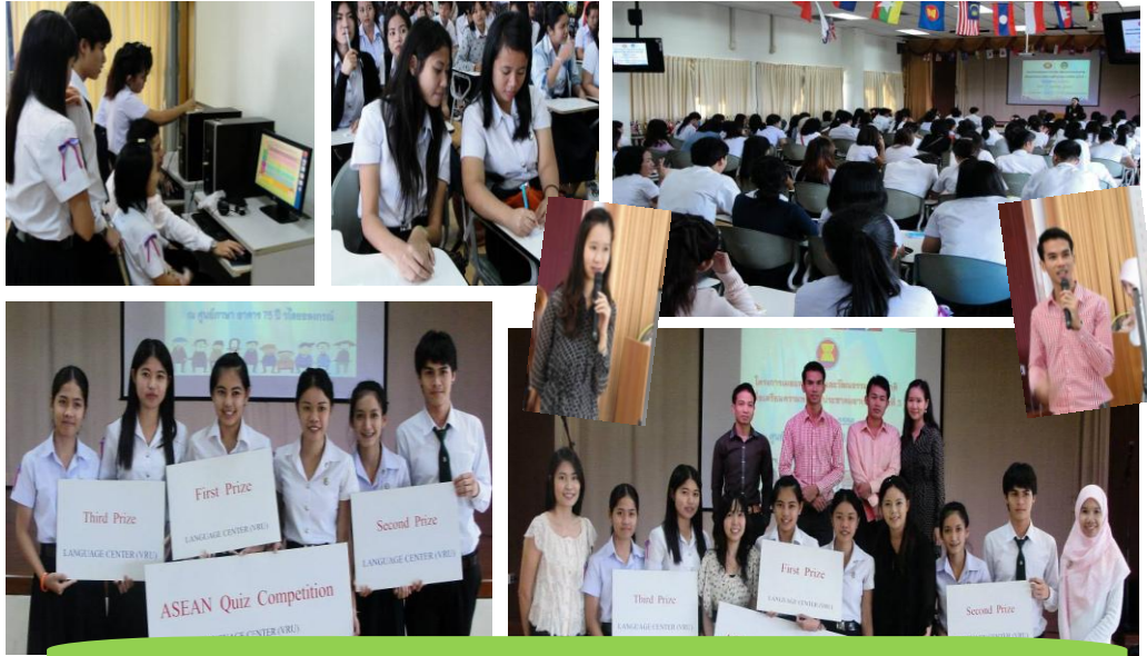
การแข่งขันตอบปัญหาอาเซียน ASEAN Quiz Competition