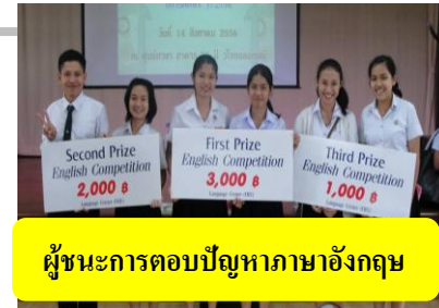
ผู้ชนะการตอบปัญหาภาษาอังกฤษ

เมื่อวันที่ 14 ส.ค. 56 ศูนย์ภาษาได้จัดการแข่งขันตอบปัญหาภาษาอังกฤษในช่วงเช้า ส่วนช่วงบ่ายเป็นการแข่งขันร้องเพลงภาษาอังกฤษ ศูนย์ภาษาจัดกิจกรรมนี้เป็นประจำทุกภาคการศึกษาเพื่อส่งเสริมการเรียนรู้และพัฒนาทักษะภาษาอังกฤษ และสนับสนุนให้ ผู้เข้าร่วมกิจกรรมสามารถแสดงออกโดยใช้ภาษาอังกฤษได้อย่างสร้างสรรค์ มั่นใจ และมีความสุข