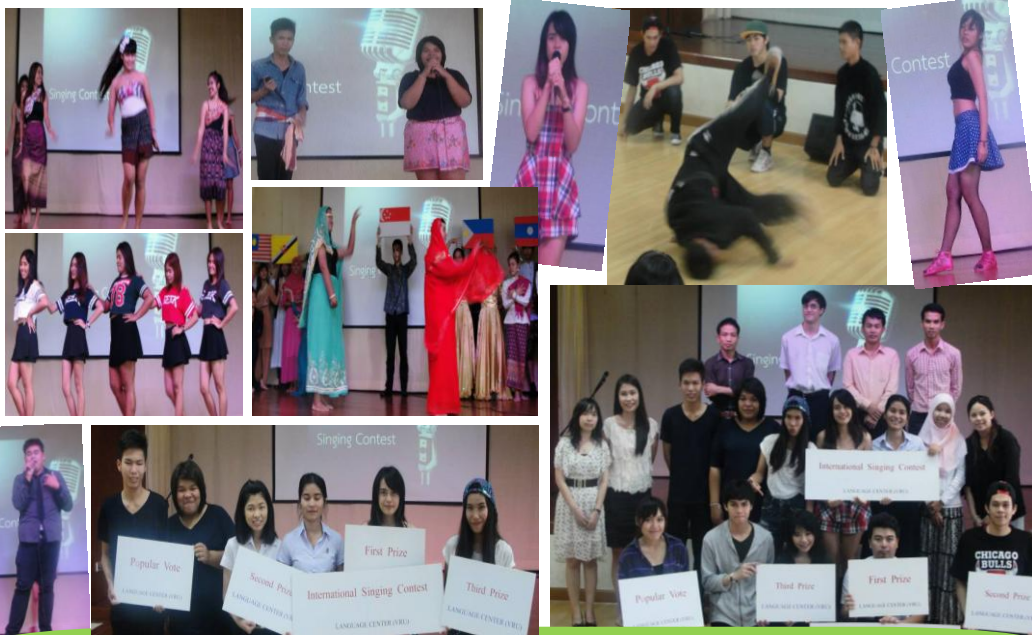
ผู้ชนะการแข่งขันร้องเพลง/เต้นรำโดยใช้ภาษาที่3ทั้งประเภทเดี่ยวและทีม