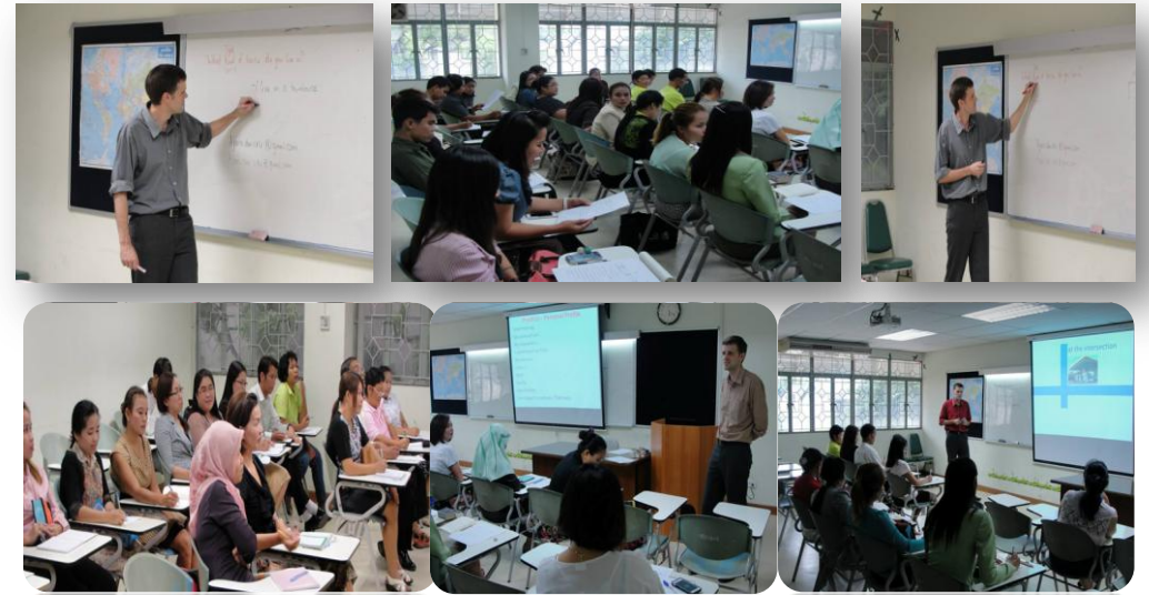
อบรม 3 ภาษา ASEAN(+3) นำร่อง พร้อมก้าวสู่ AEC (เขมร/เวียดนาม/จีน) สำหรับนักศึกษา, บุคลากรมหาวิทยาลัยราชภัฏวไลยอลงกรณ์ 16 ก.ค. – 6 ส.ค.56

สำหรับบุคลากรสายสนับสนุนมหาวิทยาลัยราชภัฏวไลยอลงกรณ์ 16 ก.ค. – 13 ส.ค.56