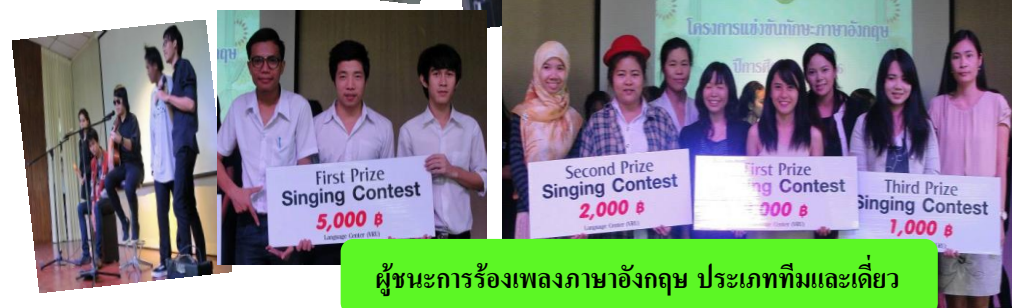
ผู้ชนะการร้องเพลงภาษาอังกฤษ ประเภททีมและเดี่ยว